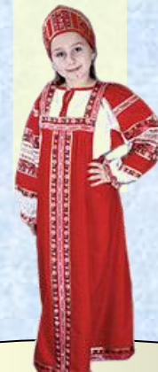
народно- сценический танец