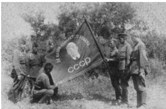
Освобождение Севастополя – последняя операция

Это всего лишь два эпизода из множества, ведь немцы постоянно охотились за гвардейскими миномётами, и уцелеть можно было только благодаря отличной боевой выучке взвода.